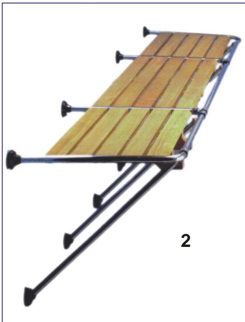
2) Modello "Ustica" diviso in 3 luci. "Ustica" model with three movable supports. Code # 11196 - 55x170 cm Code # 11197 - 55x200 cm Code # 11198 - 55x230 cm

Plancette di poppa in acciaio inox e legno Doussie. Sono provviste di attacchi distanziatori telescopici in acciaio inox e snodi in plastica, che consentono una perfetta sistemazione della plancetta sulle varie inclinazioni degli specchi di poppa. Tubo da mm 25, predisposte per montaggio scaletta e supporto motore ausiliario.