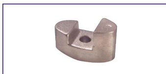
Anodo a piastra bow propeller SERIE KW3 Ring for bow propeller Code # 30956