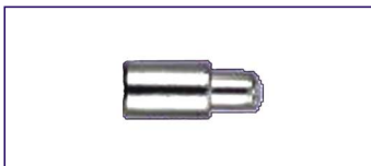
Anodo a barilotto senza tappo 3/8" Misure 10 x 17 mm. Innesto 8 mm. Rod for engine without 3/8" top Code # 30840