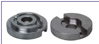
Anodo a piastra SERIE BOW THRUST kgf 75-95 Ring for bow thrust Code # 30952