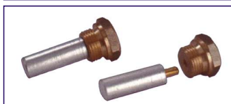
Anodo a barrotto (senza tappo) Misure 12 x 35 mm. Rod for engines without top Code # 30783