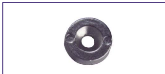
Anodo a rondella SERIE 6 HP Ring for engines Code # 30934