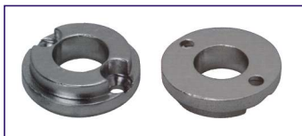
Anodo a piastra SERIE BOW THRUST kgf 25 Ring for bow thrust Code # 30950