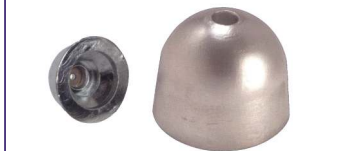
Anodo a ogiva conica con inserto inox SERIE 84 mm. x 52 h. Conic ogive with inox insert Code # 30955