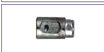
Anodo a barilotto Misure 26 x 25 mm. Innesto 22 mm. Rod for engine Code # 30842