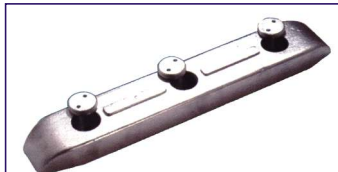
Anodo a placca 10 kg. SERIE MARINA MILITARE ITALIANA Dim. 500x80x40 mm. Plate for engines Code # 30771