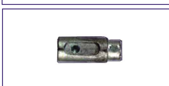
Anodo a barilotto Misure 14 x 26 mm. Innesto 10 mm. Rod for engine Code # 30841