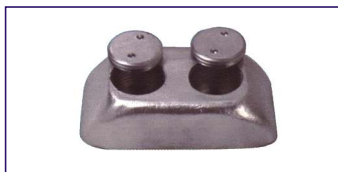
Anodo a placca 2,8 kg. SERIE MARINA MILITARE ITALIANA Dim. 150x80x40 mm. Plate for engines Code # 30770