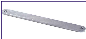
Anodo a placca SERIE LUNGA Long plate for engines Code # 30858