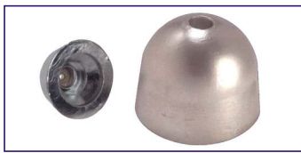
Anodo a ogiva conica con inserto inox SERIE 68 mm. x 54 h. Conic ogive with inox insert Code # 30954