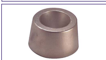
Anodo a rondella SERIE VETUS Ring for vetus Code # 30957