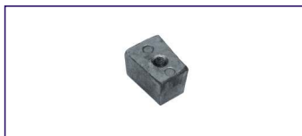
Anodo a placca SERIE 40 HP Plate for engines Code # 30620