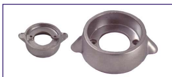
Anodo a collare Collar for engines Code # 30780