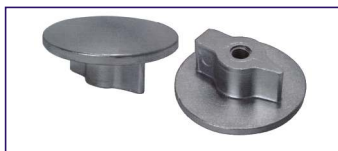
Anodo a piastra Plate for engines Code # 30775