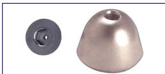
Anodo a ogiva esagonale SERIE 60 mm x 41 h. Hexagonal ogive Code # 30953