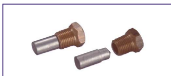
Anodo a barrotto (senza tappo) Misure 10 x 18 mm. x 8,5 mm. Rod for engines without top Code # 30781