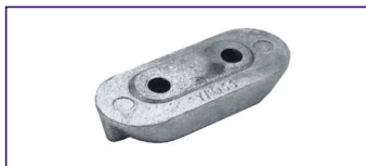
Anodo a placca SERIE 40 HP Plate for engines Code # 30616