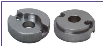
Anodo a piastra SERIE BOW THRUST kgf 35-55 Ring for bow thrust Code # 30951